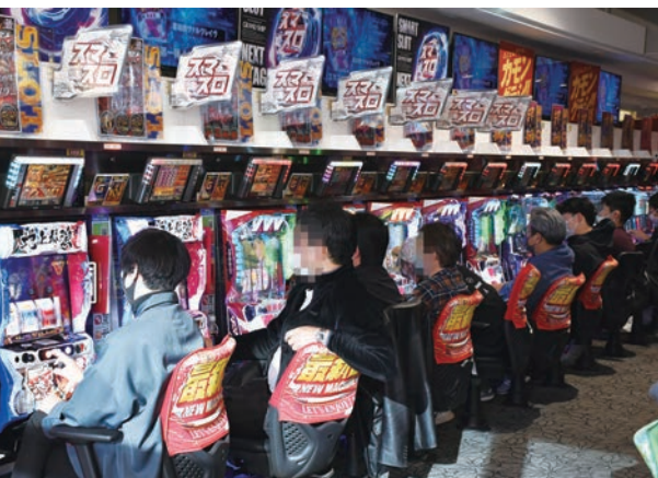
7台でスタートしたスマスロコーナー。その後増台し、年明けは20台で臨む

セキュリティが強化されているので、ゴト行為の撲滅に資することなくるのでホールスタッフの負