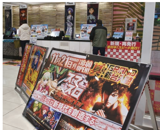
賞品カウンターまわりでもスマスロ導入をPR

同店は、コロナ禍により以前の5〜6割に減少した顧客がようやく約8割に回復。パチンコ・パチスロ別にみると、パチスロは旧規則機撤去のダメージがまだ尾を引き、パチンコ営業とのバランスが取り