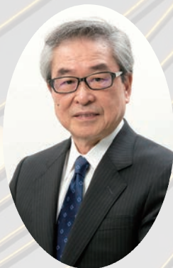
一般社団法人 遊技産業健全化推進機構

昨年9月、政府は新型コロナウイルス感染拡大防止と社会経済活動の両立を図る方針を決め、少しずつですが以前のようない日常生活が戻ってまいりました。遊技業界の不正根絶を目指す当機構の活動も、皆様方のご協力もあって順調に行うことが出来ました。新年もいっそうの健全化に向け邁進する決意です。変わらぬご支援をお願いいたします。