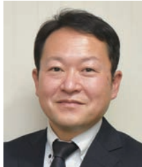
◀三慶商事の西山大取締役営業推進部長(左)と田代店長