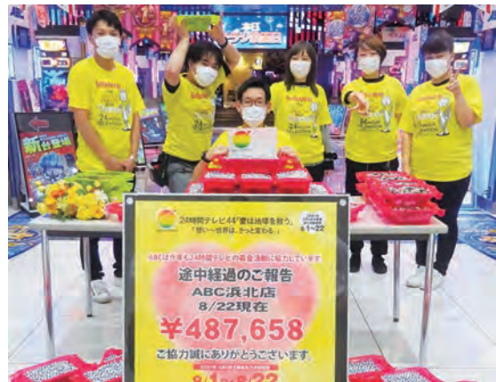
チャリティー番組「24時間テレビ」には28年間協力。来店客の協力のもと、静岡県内で断トツの貢献をしてきた