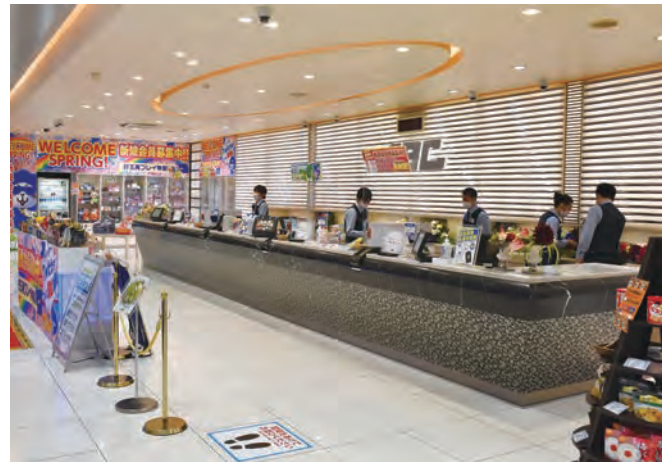
静岡市内にあるABC静岡中吉田店。店内には同社の社会貢献活動の取組みを掲示。「社会に胸を張れる企業に」が浸透し、スタッフのモチベーションは高い

こちらも同様の基本姿勢に基づくものようだ。翌19年から児童養護施設等退所児童応援事業に取り組みことになつたのも、奨学金返済問題を通じて、経済的問題を抱えた若年層を支援する必要性をより強く意識するようになったからだという。