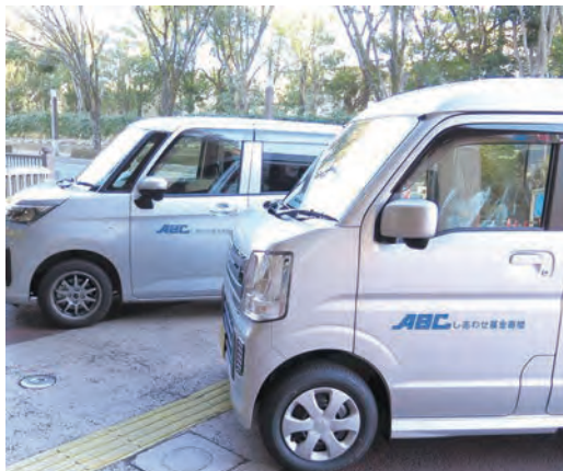
ABCしあわせ基金により累計77台寄贈してきた福祉車両。同基金は創業50周年記念事業として設立

社会貢献活動を考えることが、経営の参考になることもある。奨学金の多くが、社会人になった後