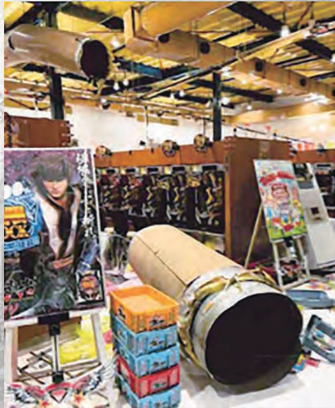
被害にあった店内の様子。 「来店客で賑わっている時間帯でなくて良かった」との声が聞かれた