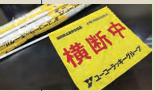
ユーコーラッキーグループが寄贈した横断旗

この取組みはFM福岡の企画によるもの。同社では運動の趣旨の一つである「子供の安全確保」に対する支援を目的に、昨年からの横断旗寄贈の形で同運動に協賛している。