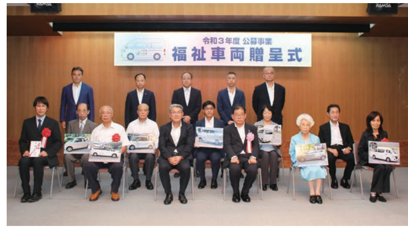
「福祉車両の贈呈事業」も神福協設立初年度から取り組んできた社会貢献活動で、2022年度も児童福祉施設など8施設に8台の車両を贈呈した

同県遊協は、19年8月には「災害時における帰宅困難者支援に関する協定」を同県、横浜市、川崎市、相模原市と締結。災害発生時は約400軒の組合員店舗が帰宅困難者に休憩場所や水・トイレなどを提供する体制を整えた。