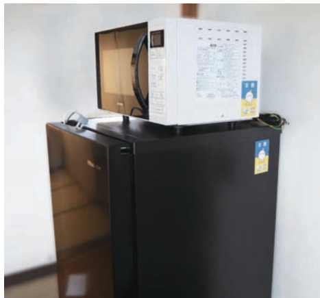
今年4月には県がウクライナ避難民のために確保している 県営住宅の5部屋分の家電・家具などを寄付した