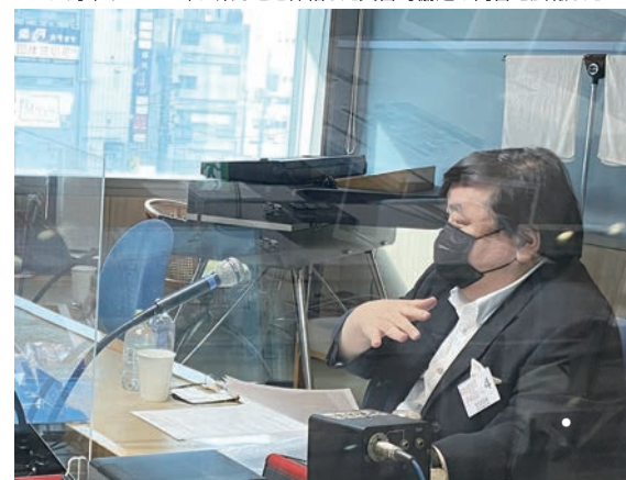
昨年6月には伊坂理事長がラジオ日本の番組に出演し、ホールでのコロナ対策や2019年に県などと締結した災害時協定の内容を広報した

部店舗のため、パチンコ店に対するパッシングが高まったが、同県では5月25日に宣言が解除され、業界を含む全ての業種が解除される運びとなった。