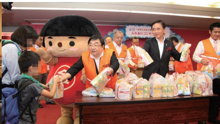
同県遊協は1985年に社会貢献の窓口として神福協を設立。以後、多岐にわたる社会貢献活動に取り組んできた。その代表的な事業の一つが「ふれあいコンサート招待事業」で、コンサートには黒岩知事もほぼ毎回参加してきた

した感染拡大予防ガイドラインの順守を徹底するだけでなく、ホールの換気機能が優れていることの広報に努めた。県が開始した「感染防止取組書・LINEコロナお知らせシステム」への登録も県内ホールに徹底。ほぼすべてのホールが同システムに登録し、県が目指す感染防止対策の「見える化」にいち早く協力した。